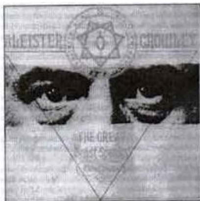
Gambar 8: Crowley

Mereka sangat membanggakan nilai kemanusiaan, persamaan hak, dan kebebasan (humanity, equality, dan freedom). Manusia dilahirkan sama dan harus mempunyai kebebasan yang sama. Seseorang melebihi yang lain, berarti melawan fitrah karena kelebihan seseorang dari yang lain, berarti telah merampas sebagian dari kebebasan manusia yang lain. La Vey menetapkan tiga ajaran pokok setanisme, yaitu memuaskan rasa ingin tahu intelektual, tindakan kebebasan individu, dan memanjakan diri (intellectual curiosity, personal liberty of action, dan physical indulgence).